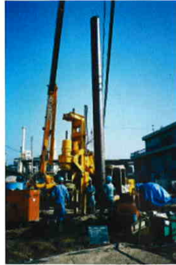
造成完了後 鋼管建込状況